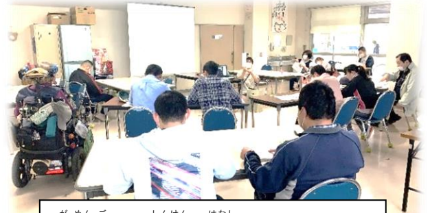
画面越しに真剣に話をしています

毎年開催している企画をオンラインで開催し、広 島市内や遠く離れた事業所からも参加してもら うことで、一緒にがんばっていく絆を感じることで きたことを発表しました。