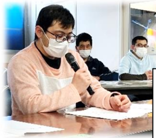
少し緊張しつつも、 しっかり思いを伝える ことができました！

今年度の活動方針などの審議や採択とともに、新型 コロナウイルスの収束の見通しが持ちにくい中、困 っている現状や一人ひとりの願いをまとめ、行政に 訴えることの大切さ、虹の会オンライン企画の開催 など、今後の活動について話し合いました。