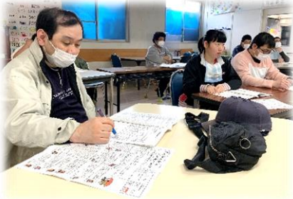
虹の会総会（オンライン会議）

夏の恒例行事「くさのみまつり」は新型コロナウイルス感染予防の観点から、地域の皆様の健康・安全面を第一に考え、中止とさせていただきます。