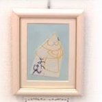
利用者の出展作品