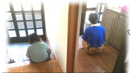
※L&Bは横並びで玄関口が2か所ある構造になっています。

朝、身支度を終わると、作業所に行く車を待ちます。2人はそれぞれ違う送迎車に乗りますが、自分が早く行きたいという気持ちから、競うように玄関に向かいます。違う玄関でそれぞれの送迎車を待つ後ろ姿がとても微笑ましく感じました。 ～グループホームL & B～