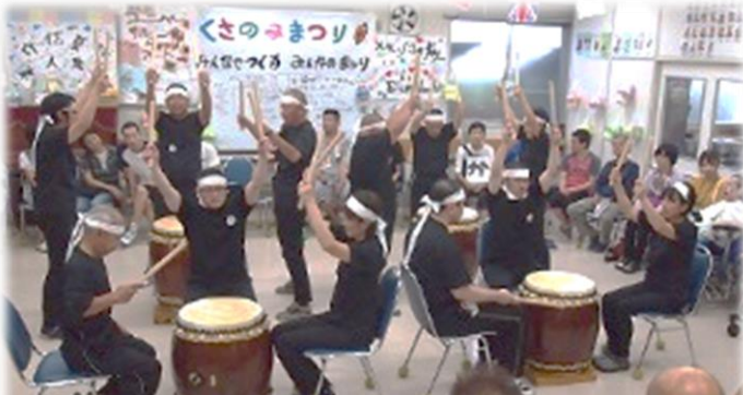
ひろろ 披露できてうれしかったあ〜♡

やく ねんまえ こうにゆう ちゆうこ わたいこ つか 約10年前に購入した中古の和太鼓を使っ れんしゅう はじめ、クラブ活動としてスタートし てから3年が経ちました。腕前はまだまだです が、初めてくさのみまつりで演奏した時には地 いき かた から げんき をもらった「感動した」と言 っていたら、とても嬉しく思いました。それ からも地域の文化祭などにも参加し、太鼓演奏 をとお ころりゆう する こと、利用者一人ひとりの たのしみと生きがいにつながっています。