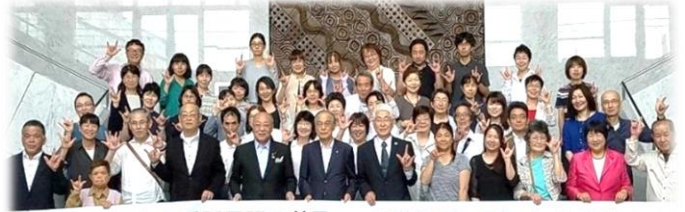
廿日市市手話言語の普及及び多様なコミュニケーション手段の利用促進によるやさしいまちづくり条例 成立!! 佐伯地区ろうあ協会廿日支部・はつかいち福祉ねっと 2018年6月28日 条例制定後の記念写真

「手話言語」としては県内2番目、コミュニケーションを含む条例としては県内初の条例制定です！！