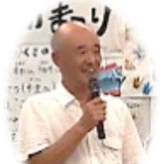
いちさとじつこういんちやう 市里実行委員長