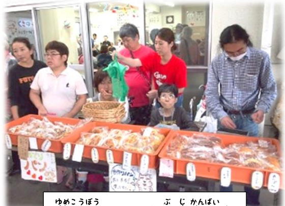
ゆめこうぼう ふ じ かんばい ☆ 夢工房のパンも無事完売☆

しかし、まつりを楽しみに練習や準備をし てきた利用者の思いを受け止め、家族、ボラン ティアさんなどと一緒に新しい和太鼓のお 披露目会をはじめ、ステージ発表やミニバザ ーを行いました。みなさんととても楽しんでおら れましたが、できれば青空のもと、地域の人と 一緒にくさのみまつりを楽しみたかったです。