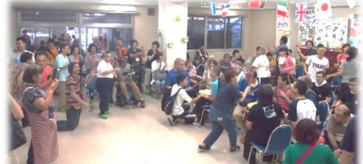
しょくどう なか 食堂の中でのステージ発表の様子