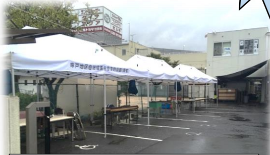
かいさい お じゅんび 開催に向け準備はしたものの…

がつ にち ど きねん すべき だい 30 かい 9月1日(土) 記念すべき第30回くさのみ まつりの開催... の予定でしたが、前日からの あめ、そしてとうじつあさからのあめ おおあめけいほう 雨、そして当日朝からの雨や大雨警報などふま さんねん ちゅうし え、残念ながら中止とさせていただきます。