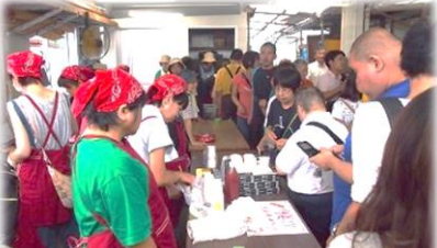
しょうきぼ わ き 小規模ながらも和気あいあい☆