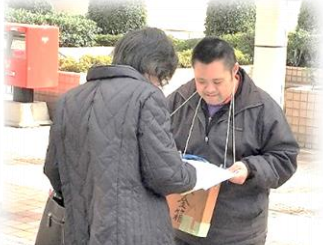
がいとうしよめいかつどう 街頭署名活動も元気に取り組みました☆

昨年未から取り組んでまいりました、署名・募金活動は、地域のみな様のご支援ご協力をもちまして、無事終了することができました。おかげ様で、署名・募金とも目標数・金額を大幅に超えることができました。本当にありがとうございました。