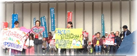
お母さんたちも壇上から訴え

5月18日、東京の日比谷野外音楽堂を会場に、「社会保障・社会福祉は国の責任で! 憲法25条を守る5・18共同集会」が開催されました。