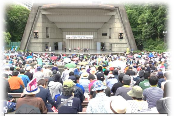
3,500人が日比谷野音に集結!