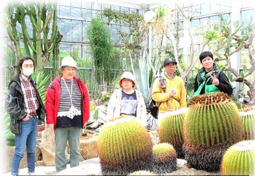
大きなサボテンを前に、みんなで 記念写真パチリ☆