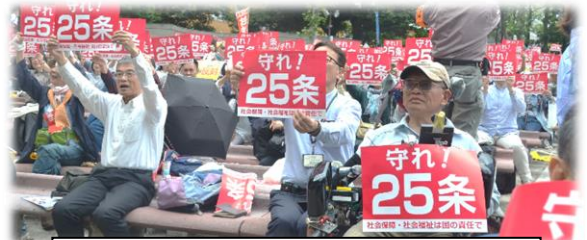
集会や、国会請願デモでも「25条を守れ!」をアピール!