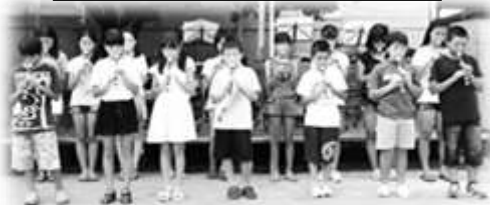
心のこもった リコーダーのハーモニー♪