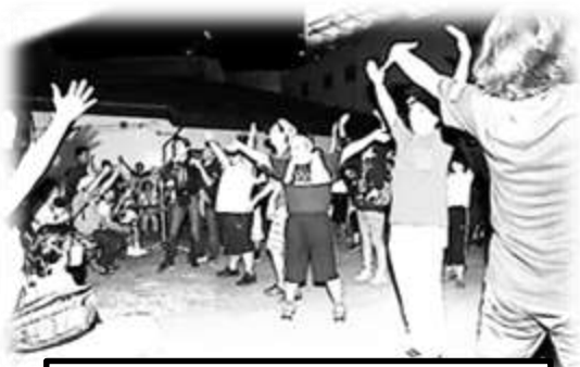
大盛り上がりのステージ発表♪♪