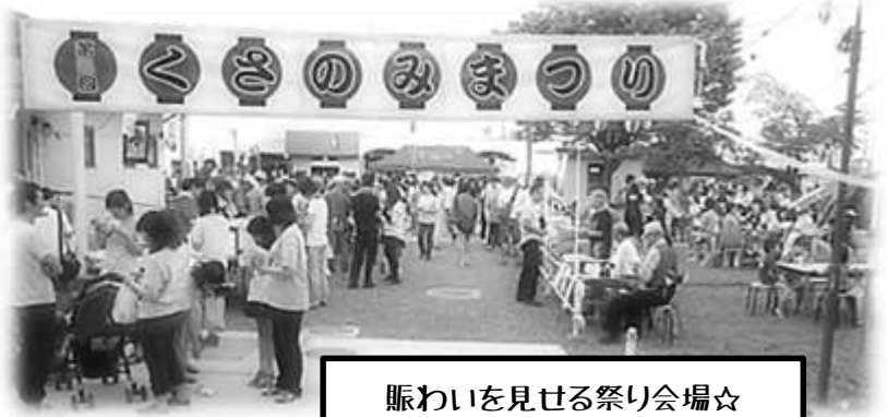
賑わいを見せる祭り会場☆

東日本大震災復興支援の取り組みとして、今回も被災地作業所の自主製品「もりのわどーナツ」を販売しました。東北の障がいのある方々の生活再建を願いながら、担当のメンバーでがんばりました(見事200個超完売!収益はもちろん全額寄付させていただきました☆)。そんなメンバーの奮闘振りに、まつりの雰囲気も相まって、みんなの笑顔が繋がっていきました。