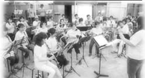
廿日市吹奏楽教室さんによる 軽快な演奏♪

販売ブースでは美味しそうな香りに誘われて、焼きそばやおでんにカレー、フランクフルトなどが次々と大勢のお客さんのお腹の中へ…。作る側も大忙しで、早々と完売したコーナーもありました。