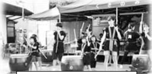
プリティパフォーマンス 「ちんまい・しんまい」