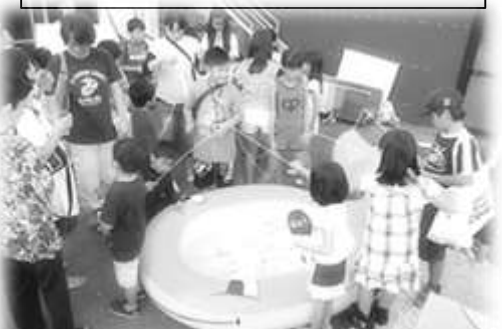
大盛況!販売コーナー